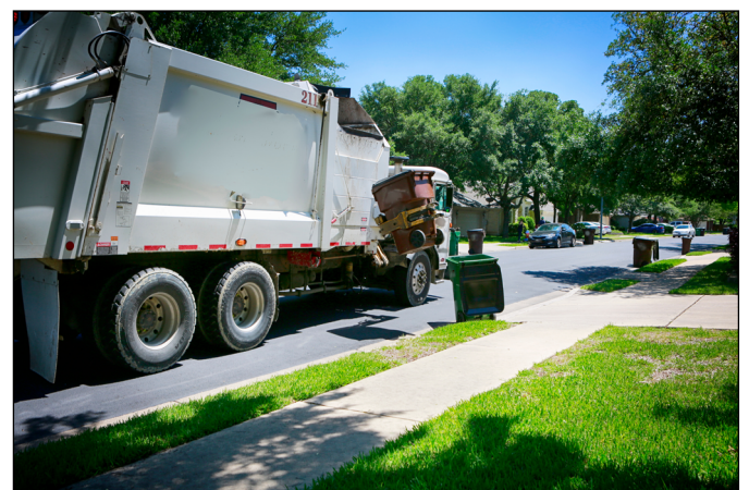
Abb. 3: Ein Seitenlader der Müllabfuhr

Neben der Geschwindigkeit sind Genauigkeit und Lärmreduzierung entscheidend, um die Kunden zufrieden zu stellen. Behältererfassungs- und Entleerungssysteme, die das Ziel verfehlen, können zu unangenehmen oder sogar gefährlichen Verschüttungen führen, ganz zu schweigen von den Verzögerungen. Die Minimierung des Lärms erhöht die Fähigkeit des Müllabfuhrunternehmens, Routen am frühen Morgen oder am späten Abend zu fahren, wenn das laute Knallen einer Mülltonne, die mit hoher Geschwindigkeit auf die Ladefläche eines Lastwagens geknallt wird, Anlass zur Beschwerde wäre.