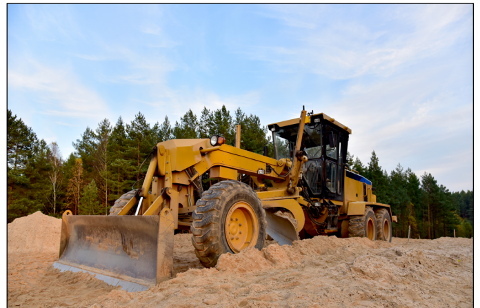
Abb. 4: Grader

Die Entwicklungsteams sind weiterhin von den Möglichkeiten der neuen Sensoren überzeugt und erforschen nun fortschrittliche Fahrzeugdiagnosen, um die vorbeugende Wartung voranzutreiben und gefährliche Zustände wie plötzlichen Verlust von Hydraulikdruck oder das Auslaufen von Hydraulikflüssigkeit zu erkennen.