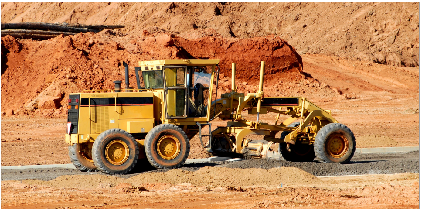
Abb. 1: Ein Grader bei seiner Arbeit

Temposonics® Sensoren in Hydraulikzylindern ermöglichen neue Funktionen